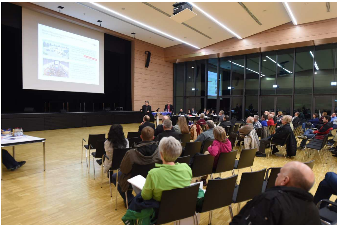
Bürgerdialog-Veranstaltung am 23. Februar 2016 in der Neckarwestheimer Reblandhalle

Frage/Anmerkung der Bürger: Warum wurde beim Genehmigungsverfahren RBZ/SAL keine Umweltverträglichkeitsprüfung (UVP) durchgeführt? Wird die EnKK diese Inhalte in der Umweltverträglichkeitsuntersuchung (UVU) zu GKN II betrachten? Ergänzt wurde der Hinweis, dass diese fehlende UVP ggf. auch beklagt werden könne.